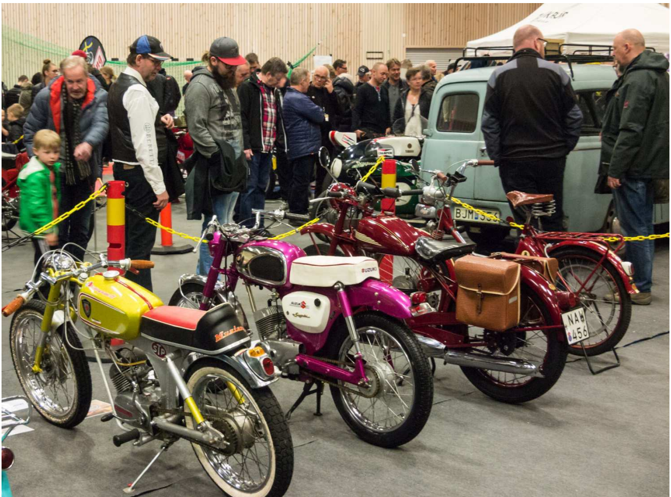
Moped fabrikat Mustang och Suzuki.