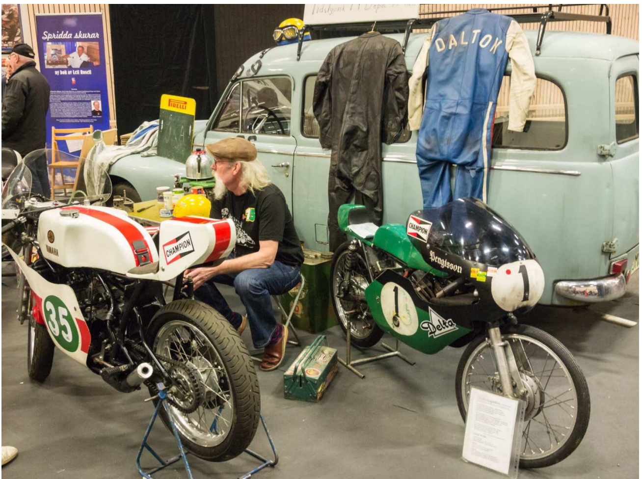
Så här kunde det se ut i depån under 60 och 70 talet.