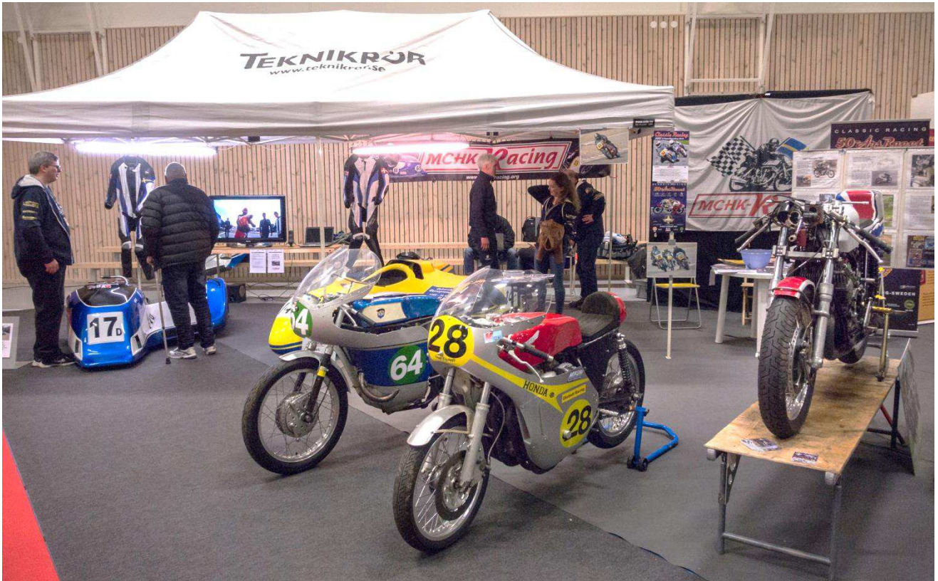
Några av racingmaskinerna i Hall B.