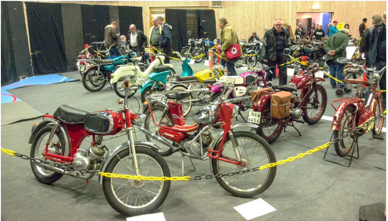
Rex mopeder, HQ Novolette och HQ 28 MC.