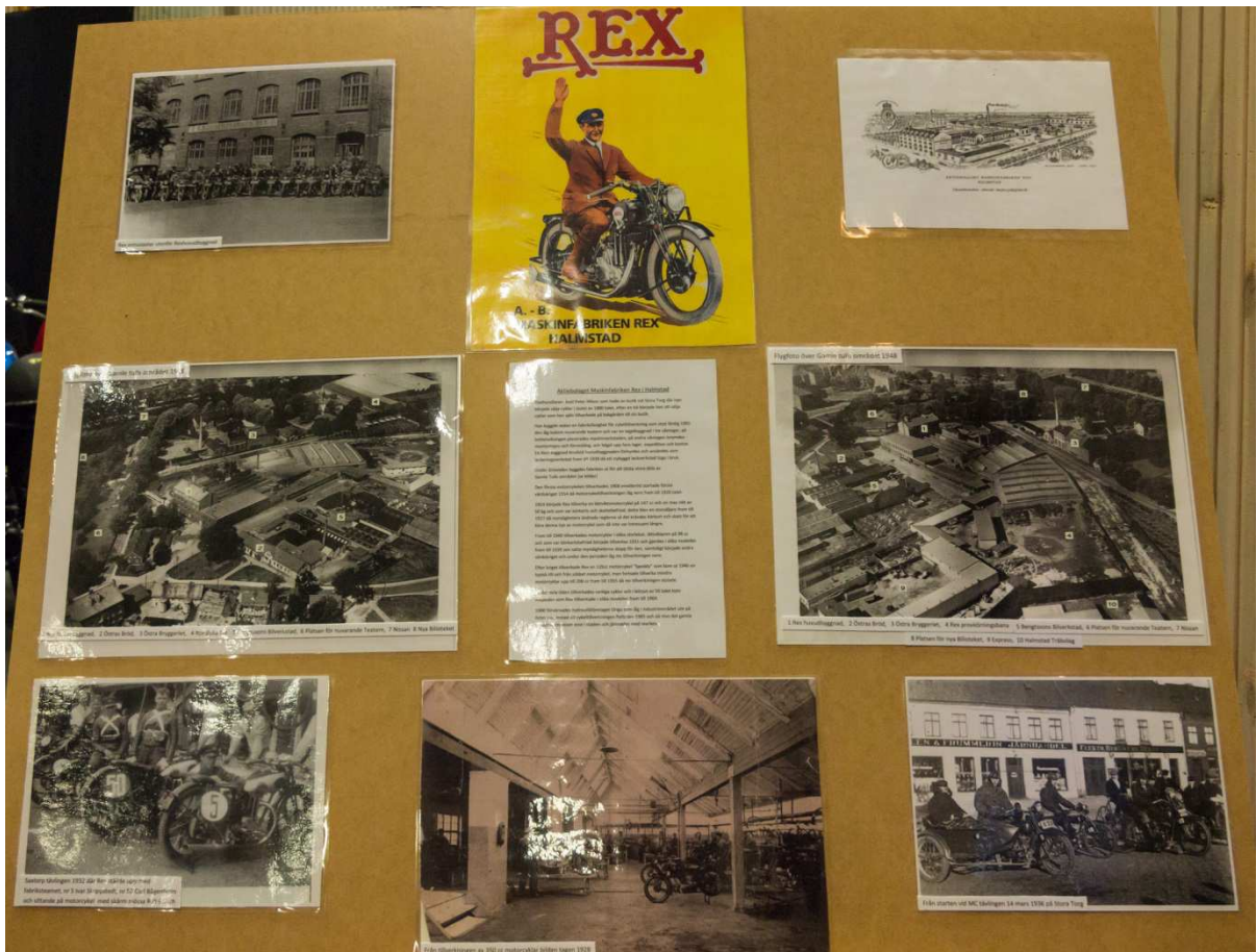
En liten historieblick tillbaka i tiden då Rexfabriken låg centralt i Halmstad centrum.