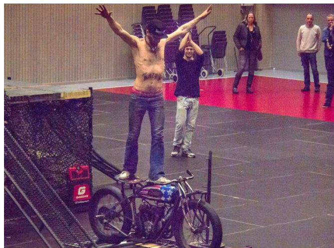
En bildserie från MC uppvisningen i Hall C av medlemmar ur Rackartygarna.