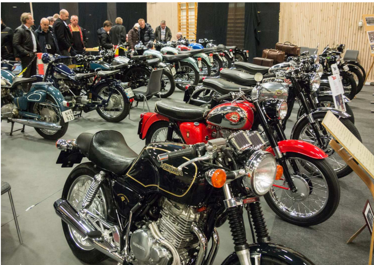
Honda och BSA i främre raden.