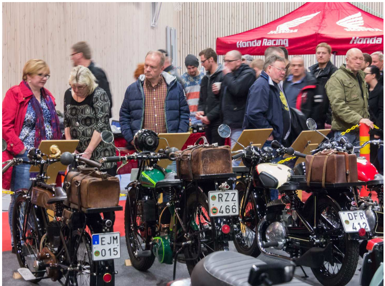
Många besökare beundrade de gamla Rex cyklarna.