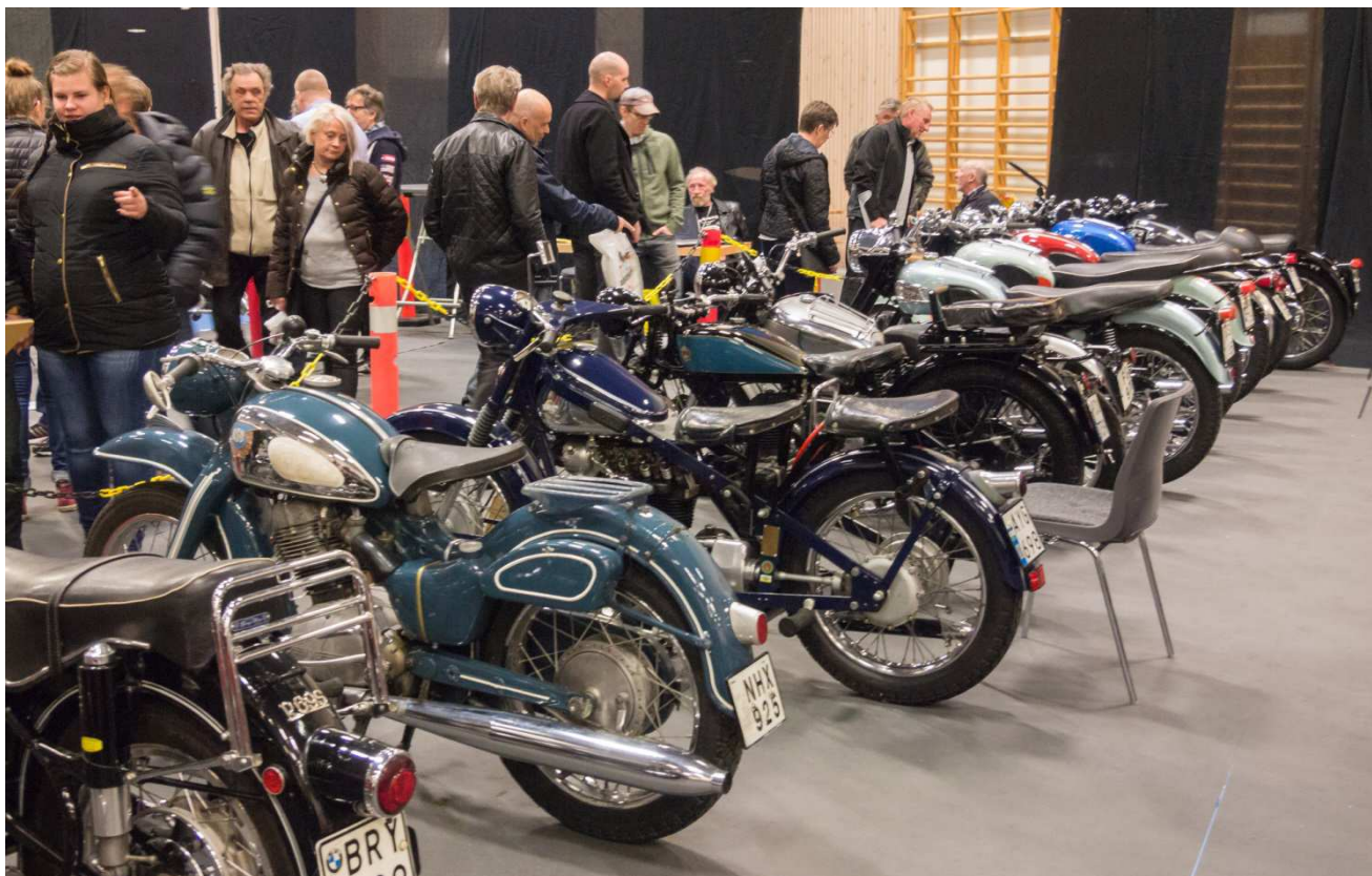
BMW, NSU, Nimbus och Triumph.