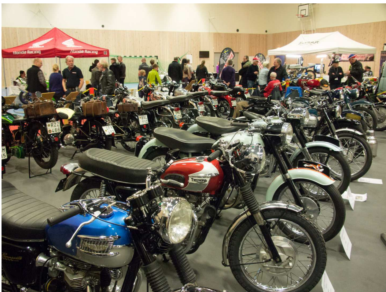
Triumph MC cc750 och cc650 av olika årsmodeller.